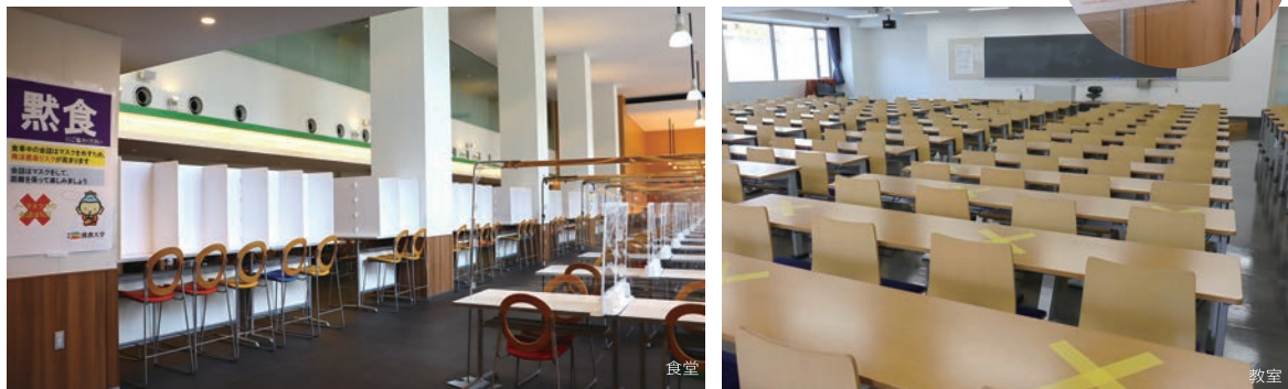
各館の入口に 体温測定サーマルカメラを設置

今後も日々変化する状況に応じ、引き続き感染拡大防止の取り組みを進めてまいります。