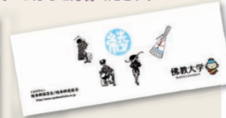
綾傘鉾×佛科大学てぬぐい①