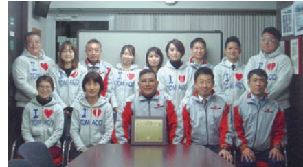
日本赤十字社より金色有功章を受章

こんな売れてるねん」と、タイ産のカニ缶を一つくれた。その後、営業先の100円ショップの店長から「缶詰はよく売れていますが、100円のカニ缶はまだないんですよ」と聞く。二つの話が結びついた。 「サイズを平分にして100円にできればヒットする。そう確信し、すぐにタイの領事館でカニ缶工場のリストをもらい、タイに飛んで10社ほど回りました。最後の会社でやっと商談がまとまり