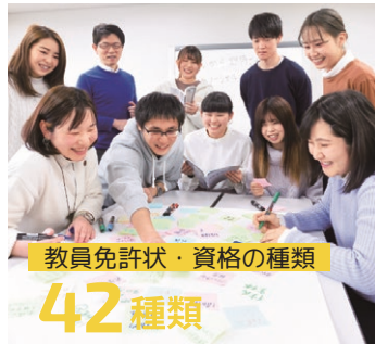
教員免許状・資格の種類

約6,000人の中規模大学で、男女比は約半数ずつです。そのうち留学生数は約50名。中国・韓国・ベトナム・タイなどから留学生が集まっています。