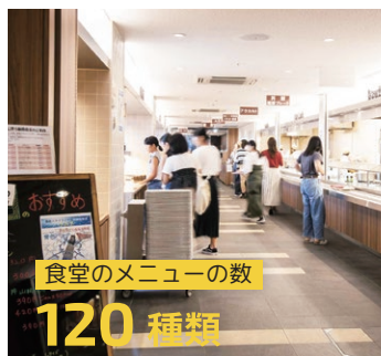
食堂のメニューの数