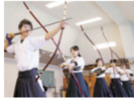
活動日:(男子)水曜、金曜、土曜/(女子)火曜、木曜、土曜 活動場所:鹿溪館屋上 弓道場

男子14人、女子10人の体育会弓道部は、紫野キャンパス学生会館「鹿溪館」屋上の弓道場で日々鍛錬しています。1996年の創部以来、「道を修める者の心得」として、揺るぎない精神を意味する「鐵心肝」を掲げています。 男子は現在、関西学生弓道リーグ3部に所属。2部昇格を目指し、弓道に向き合っています。「弓を射る」ということは、礼儀作法や師範への感謝の心も含みます。伝統、時間厳守、オンとオフの切り替えなど、弓道場で過ごした日々は、私の財産でもあります。