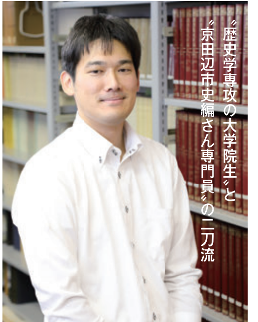
大学院文学研究科歴史学専攻博士後期課程3年生 京田辺市役所 教育部教育総務室市史編さん室 市史編さん専門員