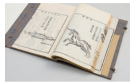
痘瘡(天然痘)の特効薬、一角(ユニコーン)【江戸後期】

て」と笑顔で話す。佛教大学HPの教員紹介メッセージには「わたしたちが普段、何げなく生きていく身体(からだ)。この身体には、しかし、目には見えない社会の「決まりごと」がさまざまに絡みついています。わたしたちは、それら「決まりごと」の網の目を、