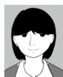
前髪で目が隠れている