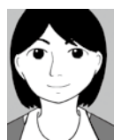
頭頂部がきれいている